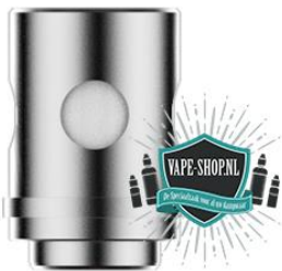
ECU Universele Coil