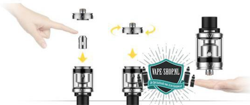
3. Na het voorprimen UEC coil in de tank stoppen en vervolgens de base er weer op draaien