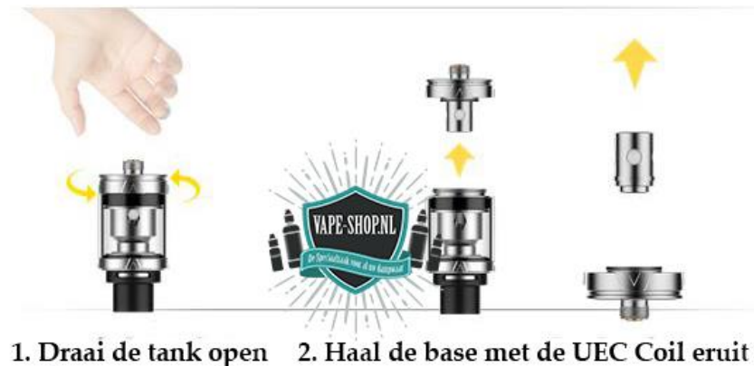
1. Draai de tank open