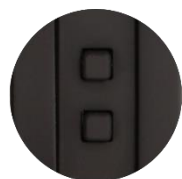
Up/Down Wattage Control