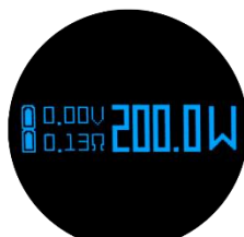
Blue LED Display