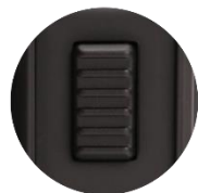
Large Firing Button (Click 5 Times To Turn On)

Afmetingen: 95 x 31.7 x 62mm Materiaal: ABS + PC, Stainless Steel Wattage: 5W-200W Weerstand: 0.07 Ohm - 3.0 Ohm Min Temperatuur 200°F / 100°C Max Temperatuur 600°F / 315°C Uitgangsmodus: Ti, Ni, SS, VW Weergave: OLED Display